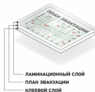
ПЛАН ЛАМИНИРОВАННЫЙ С КЛЕЕВЫМ СЛОЕМ