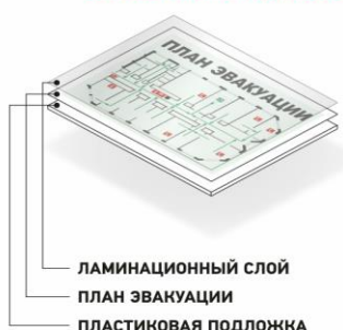
ПЛАН ЛАМИНИРОВАННЫЙ НА ПЛАСТИКОВОЙ ПОДЛОЖКЕ