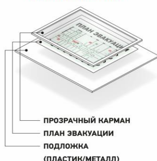
ПЛАН В КАРМАНЕ НА ПОДЛОЖКЕ ИЗ ПЛАСТИКА/МЕТАЛЛА